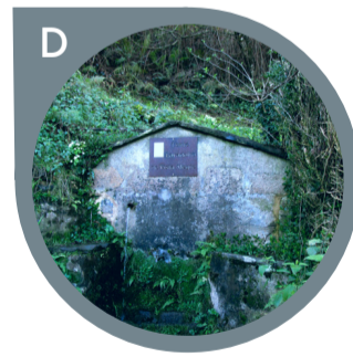
FUENTE - LAVADERO DE VISTALEGRE