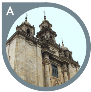
IGLESIA DE SANTIAGO