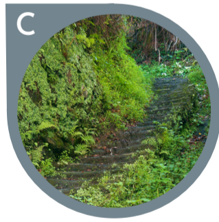
ESCALERAS DEL MONUMENTO