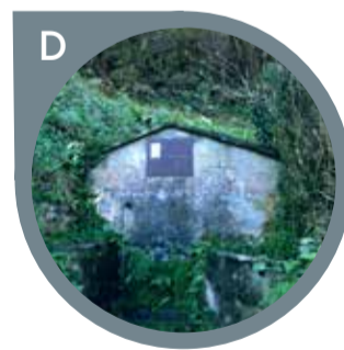
FONTE - LAVADOIRO DE VISTALEGRE