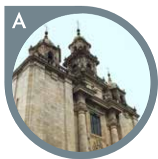
IGREXA DE SANTIAGO