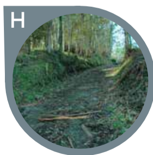
CAMIÑO A BREAMO