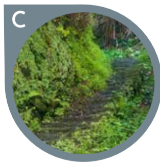
ESCALEIRAS DO MONUMENTO